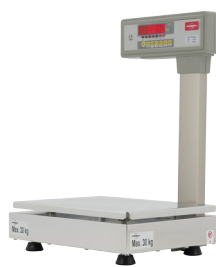
BMX0 Check-Out Tower